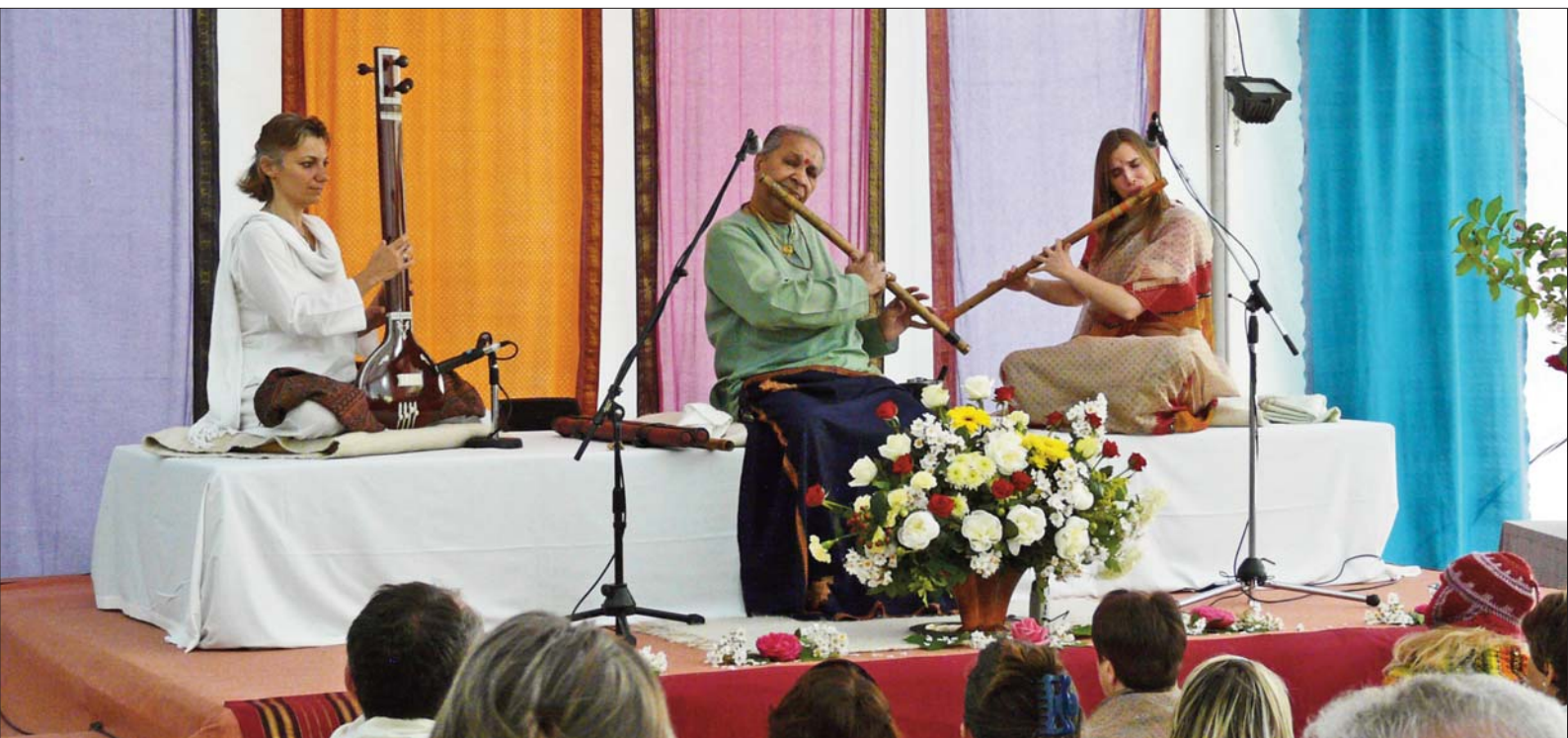
Concert avec Hari Prasad Chaurasia à Chardenoux