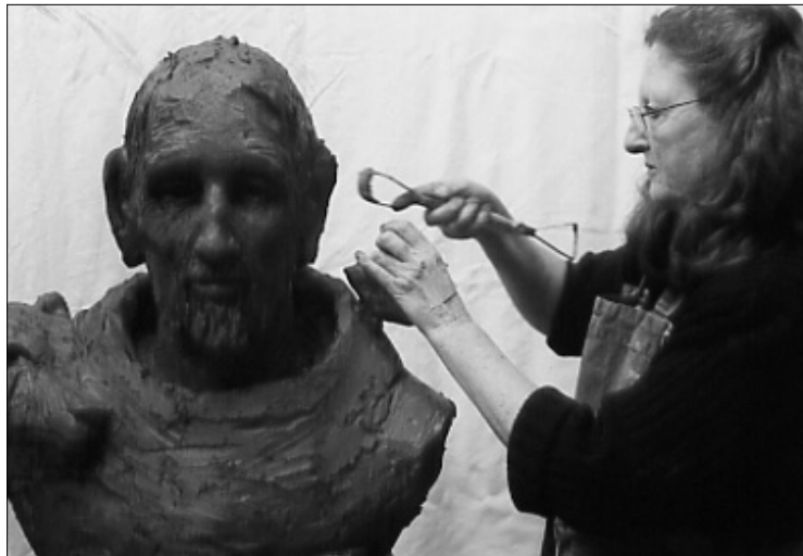
Travail sur le buste de saint François.

Avec le portrait de Mâ, par exemple, cela a été terrible au début. Pendant au moins huit heures, c'est-à-dire pendant plusieurs jours (parce que je ne travaille pas plus de deux à trois heures par jour maintenant), ce fut comme sculpter un nuage : la Présence apparaissait puis, un geste maladroit, et tout disparaissait. Il