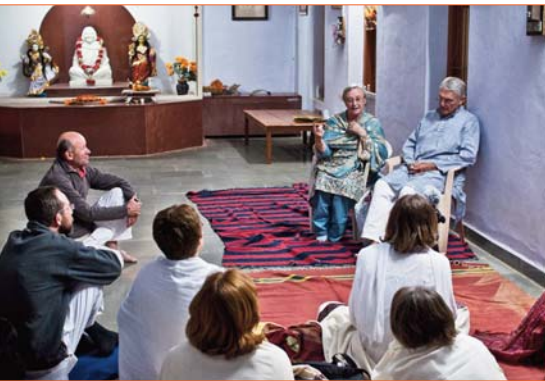
Échanges à l'ashram de Ma Ananda Mayi, à Bhimpura, avec de vieux disciples

Le premier voyage de Pranam India – ce tour de l'Inde en huit étapes – s'est terminé il y a quelques jours. C'est une formule nouvelle, expérimentée avec des personnes bien préparées par l'école Yoga Sadhana. Il ne s'agit pas seulement de voir et apprendre, mais de rapporter aussi, par le texte, la photo et la vidéo, des témoignages de l'héritage spirituel vivant de l'Inde. Le groupe est rentré enchanté.