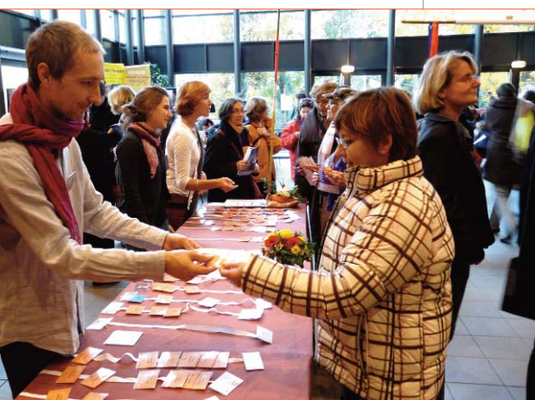
Remise des badges à l'accueil

Nous avons rencontré un haut fonctionnaire chargé des questions religieuses dans l'un des ministères, et ce fut un réconfort de voir que les positions de la Miviludes ne faisaient pas du tout l'unanimité au sein du gouvernement. C'est une lueur d'espoir.