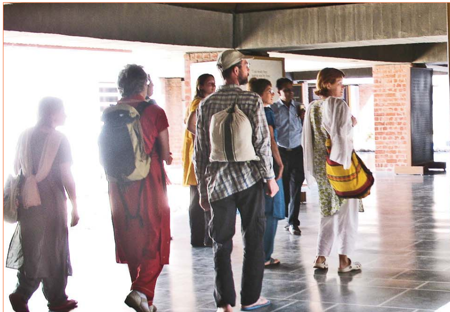
Visite de l'ashram de Gandhi à Ahmedabad