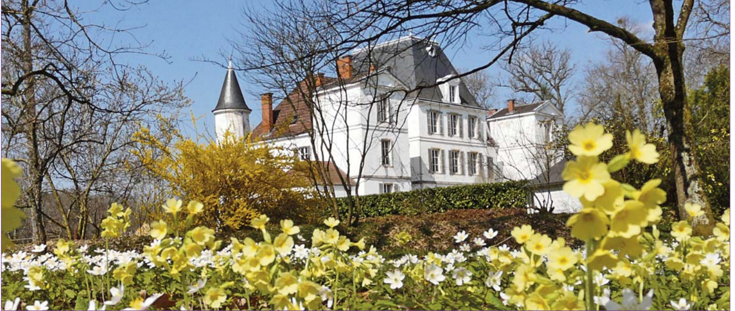
Bientôt le printemps...