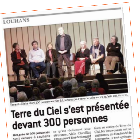
Terre du Ciel s'est présentée devant 300 personnes

Compte rendus de la réunion par les 2 journaux locaux